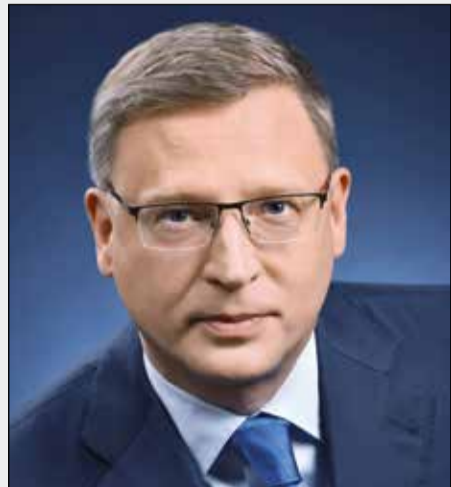
Александр БУРКОВ, Губернатор Омской области