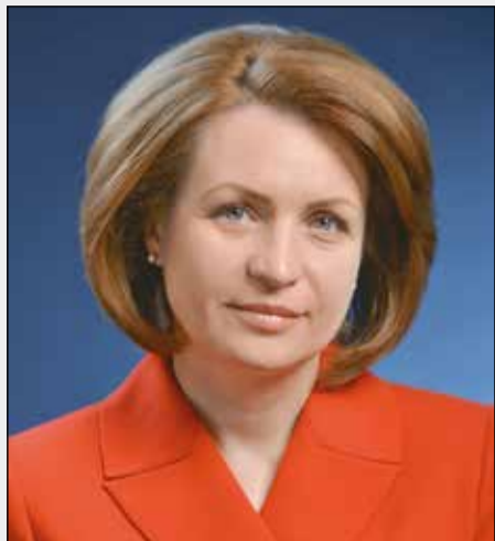
Оксана ФАДИНА, Мэр города Омска